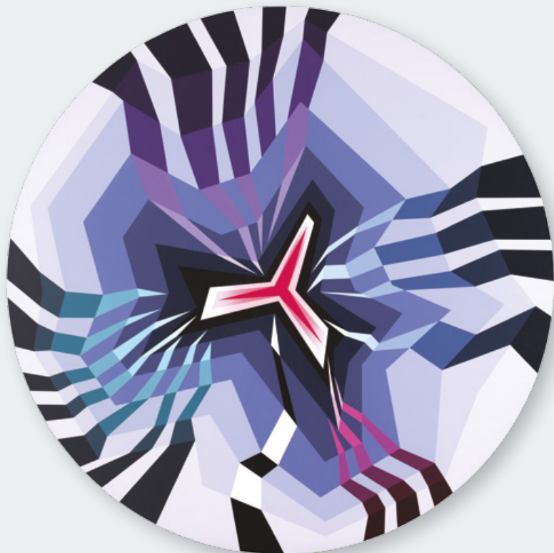
« FORTUNE FAVOURS THE BRAVE » 2017 - acrylique sur panneau de bois - 130 cm